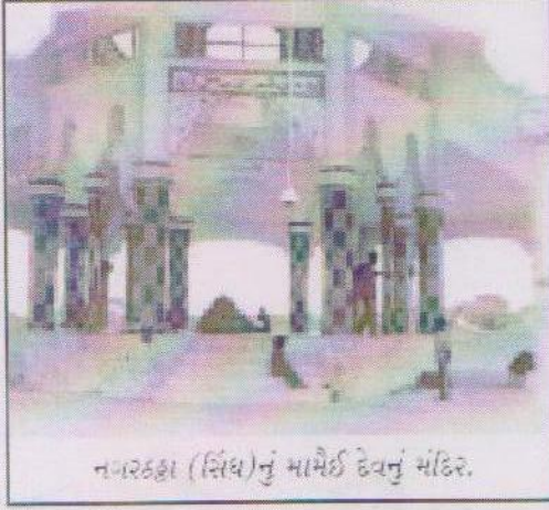
નગરકઠા (સિંધ)નું મામેઈ દેવનું મંદિર.